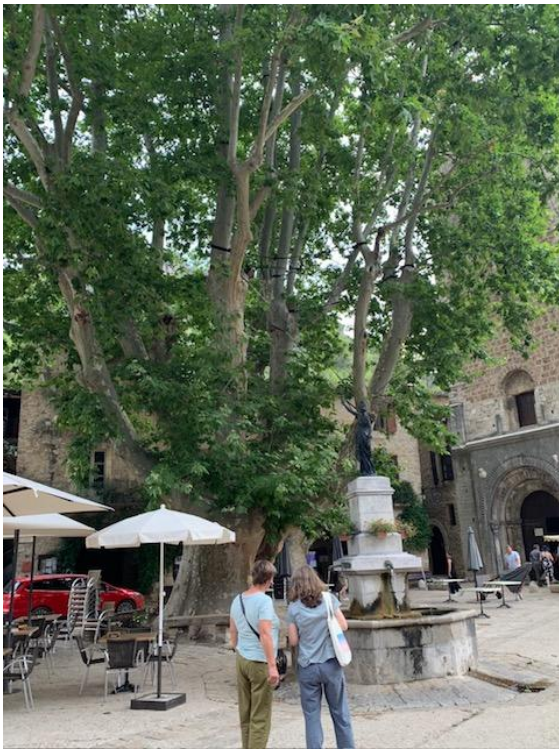
Riesige Planate von 1885 im mittelalterlichen Ort Saint-Guilhem-le-Désert