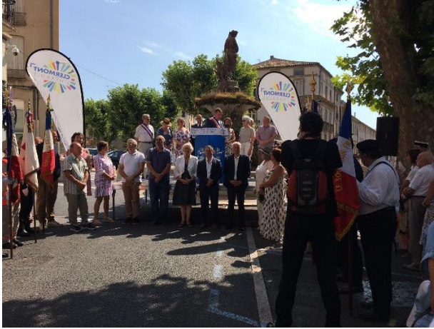
14. Juli Nationalfeiertag – Rede an alle Bürgerinnen und Bürger