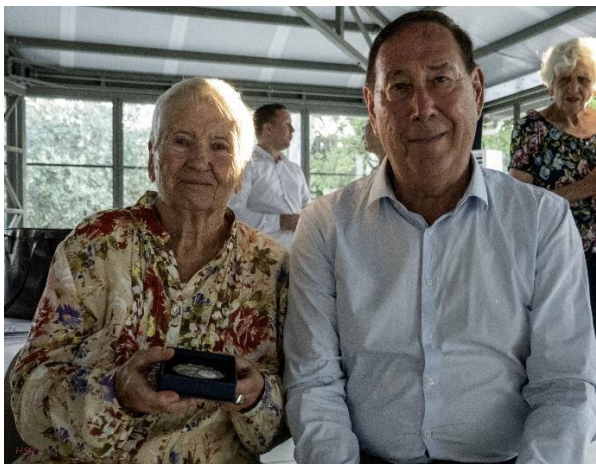
Ehrung für mehr als 50 Jahre Verbundenheit mit Clermont-l'Hérault