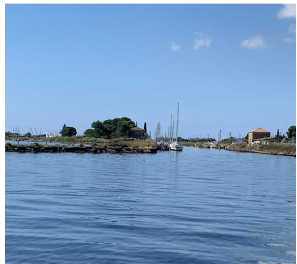
Frankreichs legendäre Wasserstraße: der „Canal du Miidi“ mündet in die Lagune