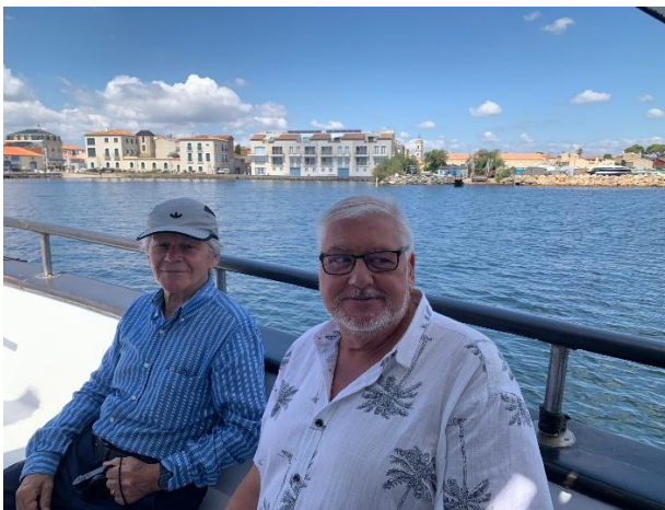
BOOTSFAHRT auf dem Étang de Thau (Lagune mit Zugang zum Mittelmeer) ab Marseillan