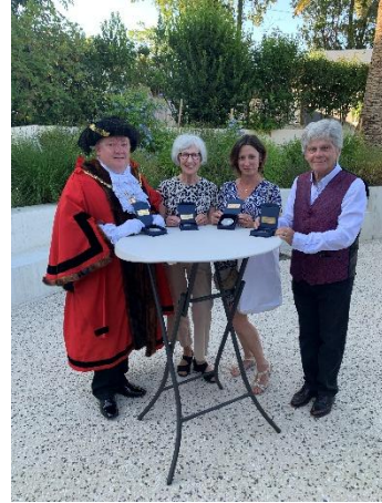
Die vier am Nationalfeiertag für ihr Engagement in der Städtepartnerschaft öffentlich geehrten Personen