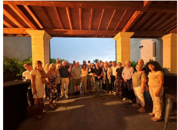
BESICHTIGUNG & VERKOSTUNG „Domaine d'Archimbaud“ in Saint-Félix- de Lodez