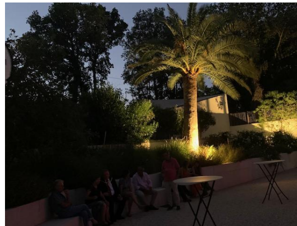
Man unterhält sich entweder im feierlichen Saal oder ab im idyllischen Garten unterhalten.