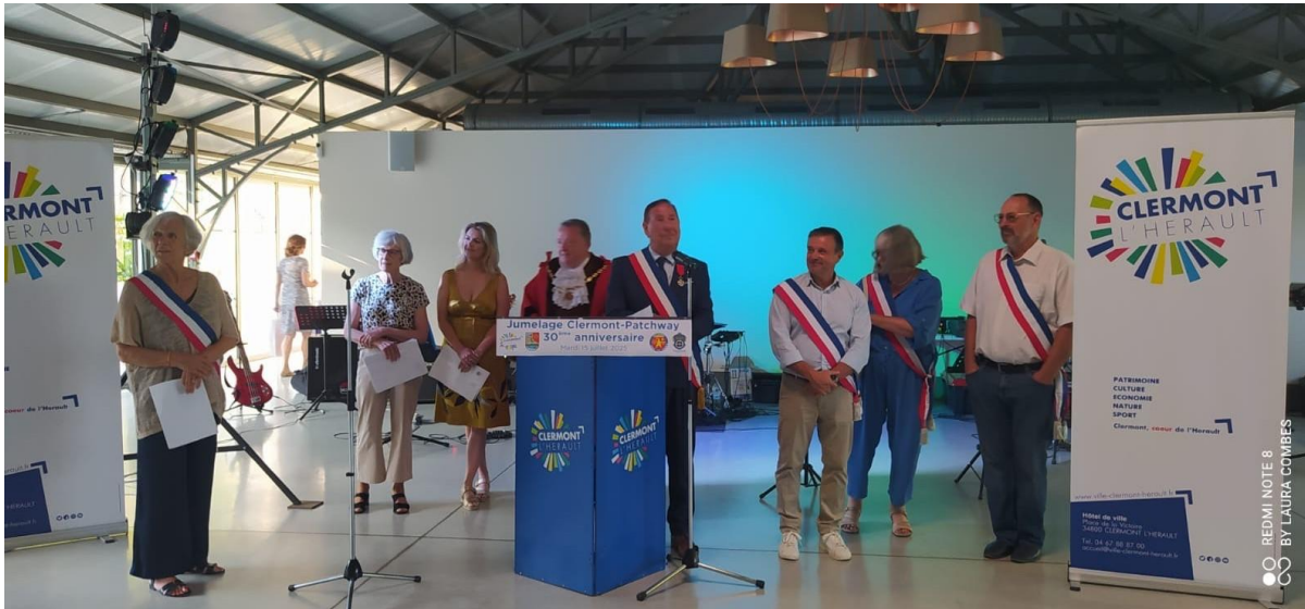
FESTAKT: 30 Jahre Städtepartnerschaft Clermont – Patchway