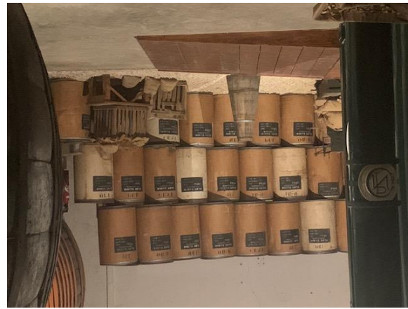
Kräuter für die Wermutherstellung wie Wermutkraut, Kardamon, Zimt ...