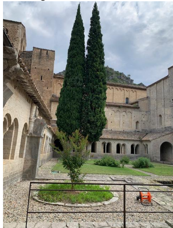
Kreuzgang der Abteikirche