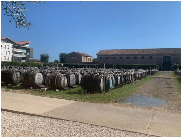
BESICHTIGUNG & VERKOSTUNG Führung im Hause „Noilly Prat“ in Marseillan