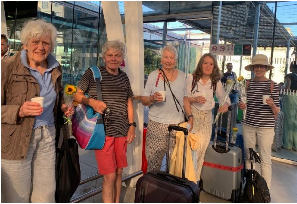
EMPFANG mit Sonnenblumen und kühlem Getränk am Bahnhof Montpellier Saint Roch