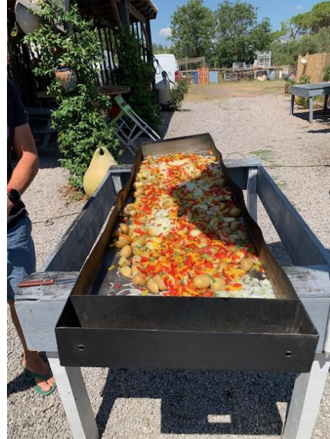
Bundes, regionales Gemüse