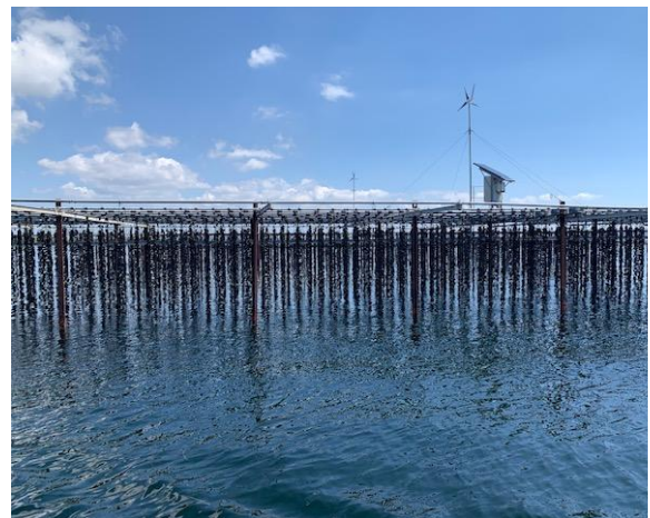
Austernfarm auf dem Thau de Thau