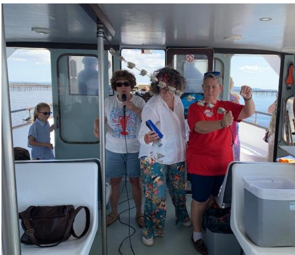
Anschauliche Erläuterungen zu Austern