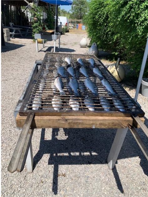
Beliebter Speisefisch „Loup de Mer“