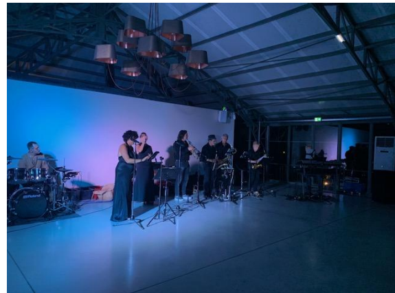
Die Band sorgt für eine äußerst entspannte Stimmung und Tanzlaune