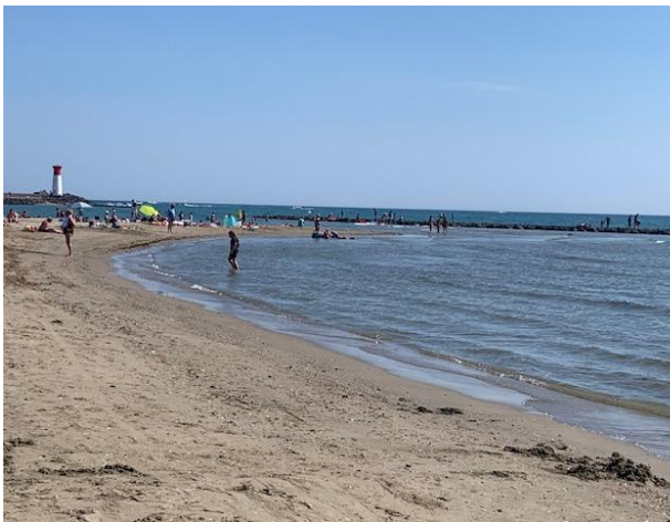
Baden am nahegelegenen Strand